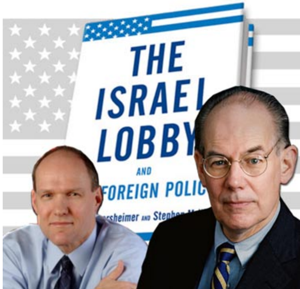
Kirjan "The Israel Lobby and US Foreign Policy" kirjoittajat, professorit Stephen Walt (vas.) ja John Mearsheimer.

Kirjoittajat eivät kyseenalaista lobbyin oikeutusta. Päinvastoin he osoittavat, että sadat samankaltaiset lobbyt näyttävät olennaista osaa Amerikan