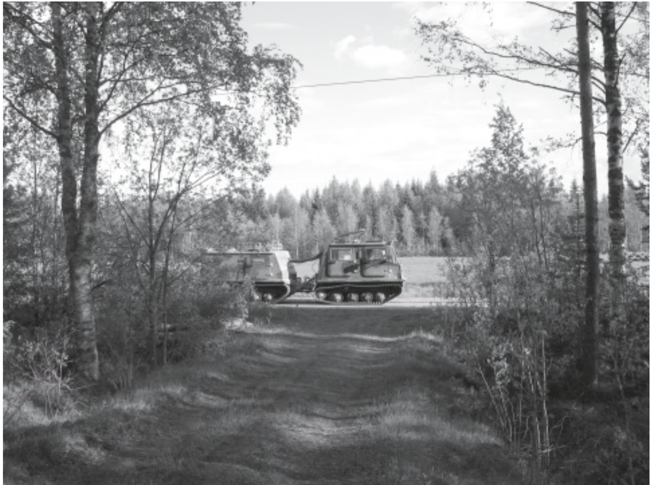
Suuliekit löivät joka puolella. Pauke oli korviahuumaavaa.

Tappamaan heidät kuitenkin koulutetaan. Neljä viidestä suomalaismiehestä päätyy edelleen reserviin. Koko maailmassa näin kattavia asevelvollisuusjärjestelmiä on alle kymmenen. Suomi hakee kaltaistaan joukosta, johon kuuluvat Pohjois-Korea, Israel, Turkki ja Singapore.