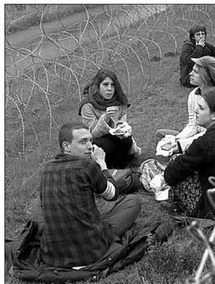
IMC BELGIA/RED KITTEN

LOKAKUUN ALUSSA Suomesta matkusti Belgiaan noin neljänkymmenen rauhanaktivistin joukko ottakseen osaa kansalaistottelemattomuuteen Kleine Brogelin lentotukikohdassa 5. lokakuu-