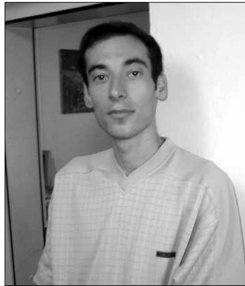
Jugoslavia: kahdella aseistakieltäytyjällä vangitsemisuhka

Petromelidisin kafkamainen tilanne on seurausta siitä, ettei hallitus käytännössä halua toteuttaa siviilipalveluslakia, joka säädettiin Kreikkaan vuosia kestäneen kampanjoinnin tuloksena 1997. Vuoden 1999 jälkeen kaikki hakemukset suorittaa vaihtoehtopalvelus asepalveluksen sijaan on hylätty Jehovan todistajia lukuunottamatta. Siviilipalveluslaki ei mahdollista myöskään lyhyempää palvelusaikaa iän tai isyyden perusteella, joilla taas armeijasta voi selvitä huomattavasti lyhyemmässäkin ajassa.