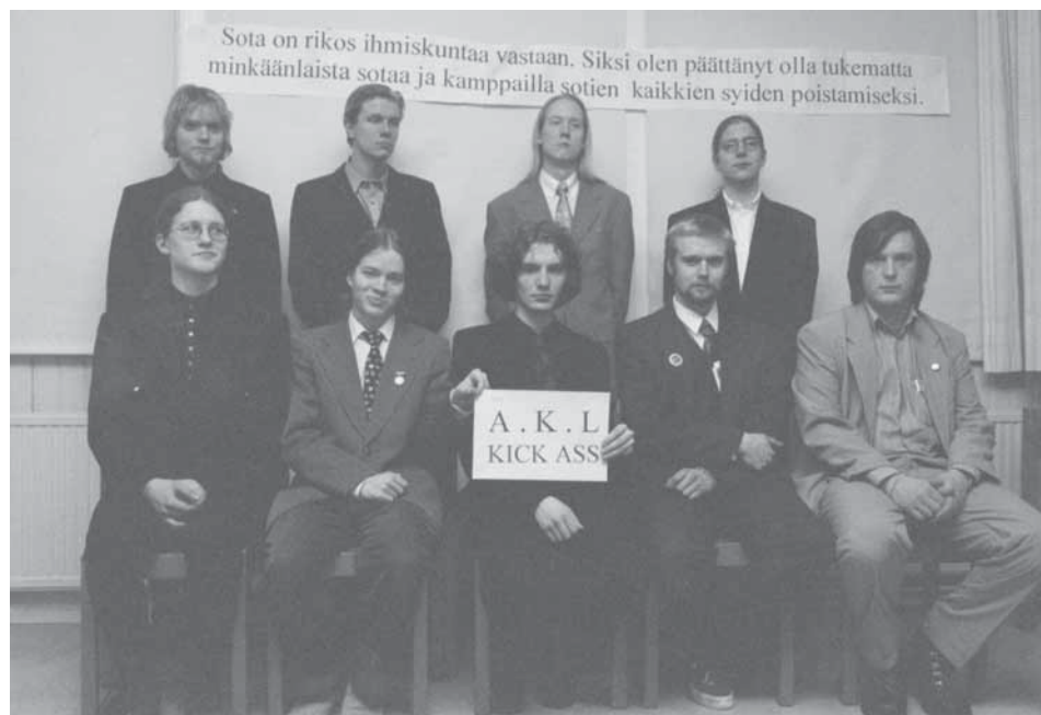
Aseistakieltäytyjäliiton hallitus liiton 25-vuotisjuhlassa (kevät 1999)