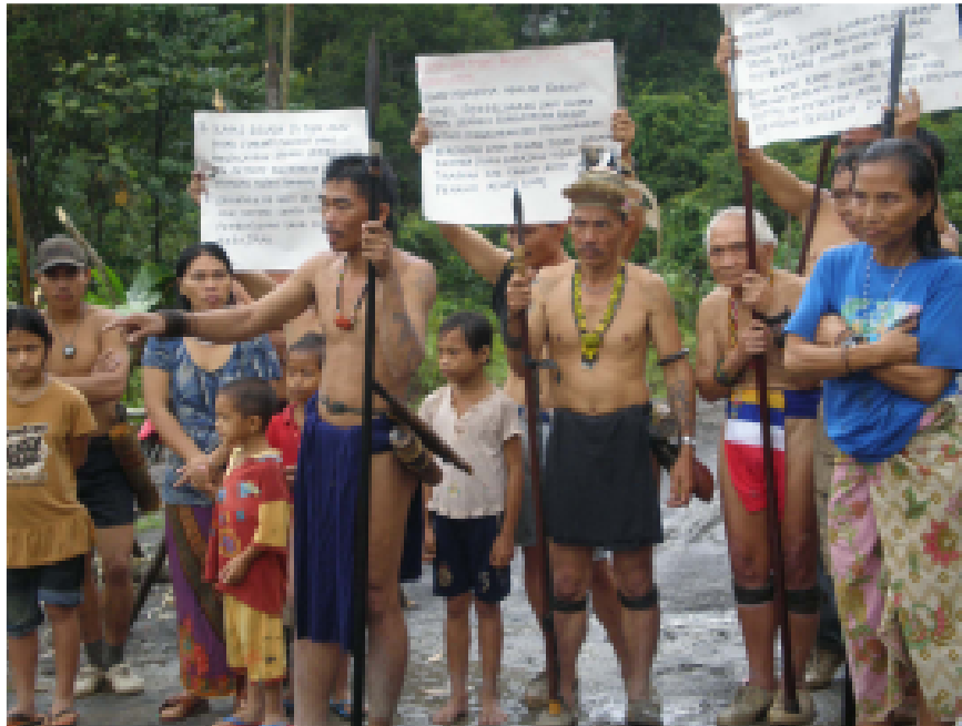
Penanien tiesulku Long Nenissä elokuussa 2009

nankylät rakensivat ja miehittivät yhdessä tiesulkuja myös Long Ninin, Long Banganin and Long Belokin kylien läheisyyteen, nostaten penanalueiden tiesulkujen yhteismäärän kahteentoista.