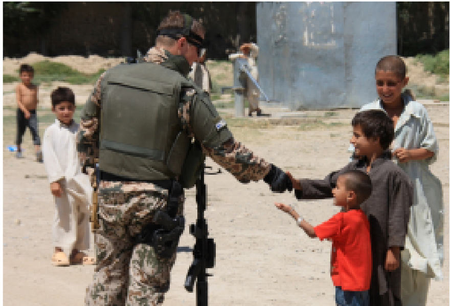
Suomalainen rauhanturvaaja ja afganistanilaisen kylän lapsia.

Syksyllä 2006 ISAF:in toiminta-alue laajeni myös Itä-Afganistaniin. Käytännössä tämä toteutettiin siirtämällä alueella toimineet USA:n terrorisminvastaisen operaation