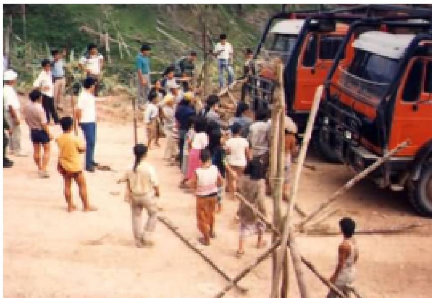
Tukkirekat pysäyttäneet tiesulku vuonna 2000

Borneo Project http://www.borneoproject.org Borneo Resources Institute (BRIMAS) http://brimas.www1.50megs.com/ Bruno Manser Fonds http://www.bmf.ch/en/ Rengah Sarawak http://www.rengah.c2o.org/about/ Sahabat Alam Malaysia http://www.foe-malaysia.org/ Survival International http://www.survival-international.org/