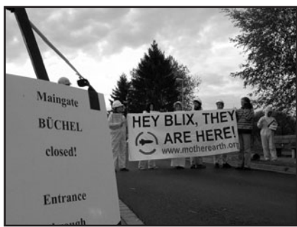
Sotarikostarkastajat Büchelin lentotukikohdan pääportilla.

Kansalaistarkastajat saapuivat Itävallasta, Belgiasta, Iso-Britanniasta, Ranskasta, Saksasta, Maltalta, Ruotsista ja USA:sta. Tarkastuksia jatketaan ydinaseisiin yhteydessä olevissa laitoksissa ympäri maailmaa. Seuraava tarkastus tehdään 25. lokakuuta Naton sotilaalliseen päämajaan Monsissa, Belgiassa.