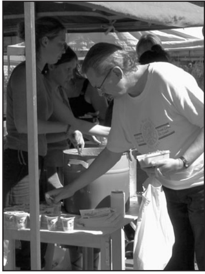
Ilmaista ruokaa Malmilla

Tapahtuman ensimmäiset päivät sujuivat uuteen ympäristöön sopeutumisen, banderollien ja rintanappien askartelun sekä opinto-osuuksien merkeissä. Leiriläiset saivat kuulla Ruokaa ei aseita -kampanjasta, sosiaalisista ongelmista Helsingissä, väkivallattomuudesta, kasvissyönnistä ja ihmisoikeuksista. Ensimmäisen viikon torstaina ja perjantaina ohjelmassa olivat ensimmäiset ruoanjaot Herttoniemessä ja Malmilla. Viikonloppuna leiriläiset saivat tutustua Suomenlinnan nähtävyyksiin sekä suomalaisen kesämökkikulttuuriin Vanhankaupungin kulttuuriekologisen klubin isännöimänä. Toisella viikolla ruokaa jaettiin vielä Myllypurossa, Kontulassa ja Hakaniemessä.