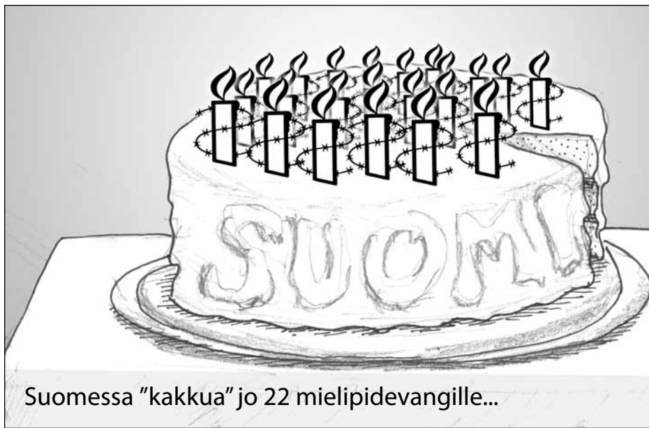
Suomessa "kakkua" jo 22 mielipidevangille...