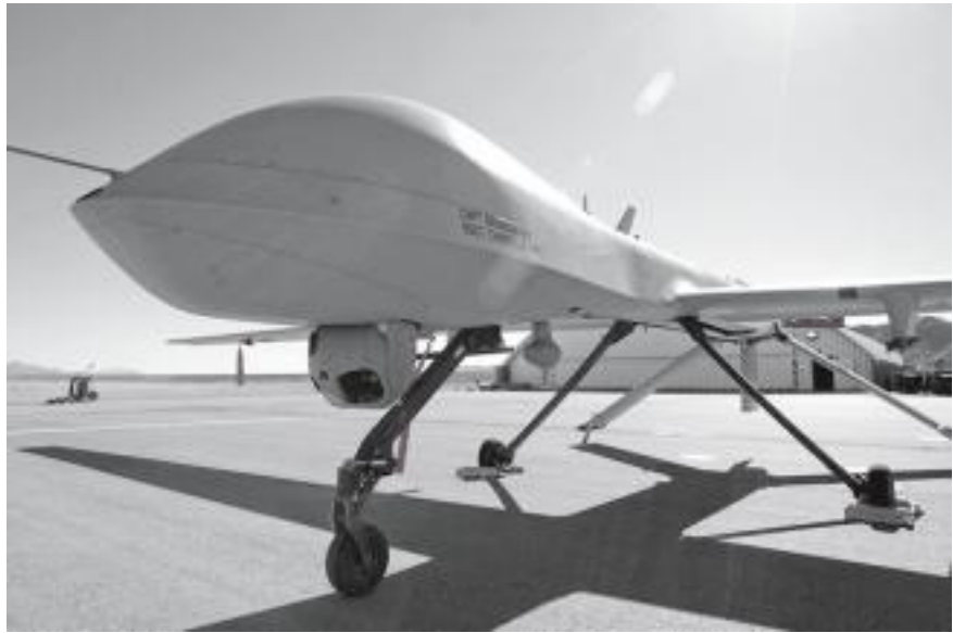
U.S. Marine corps

Omana sotarobottiryhmään voidaan mainita vartiorobotit, jollaisia käyttävät ainakin Etelä-Korean ja Israelin armeijat. Etelä-Koreassa rajavyöhykkeellä käytetty SGR-A1-malli ampuu paikallistamia tunkeilijoita itsenäisesti,