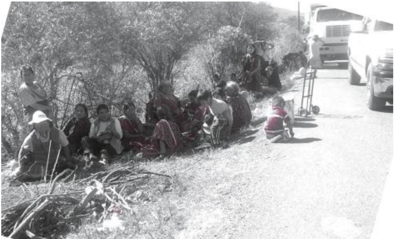
Joukko puolisolitaallisen UBISORT-ryhmittymän San Juan Copalan rajalle pysäyttämiä kyläläisiä.