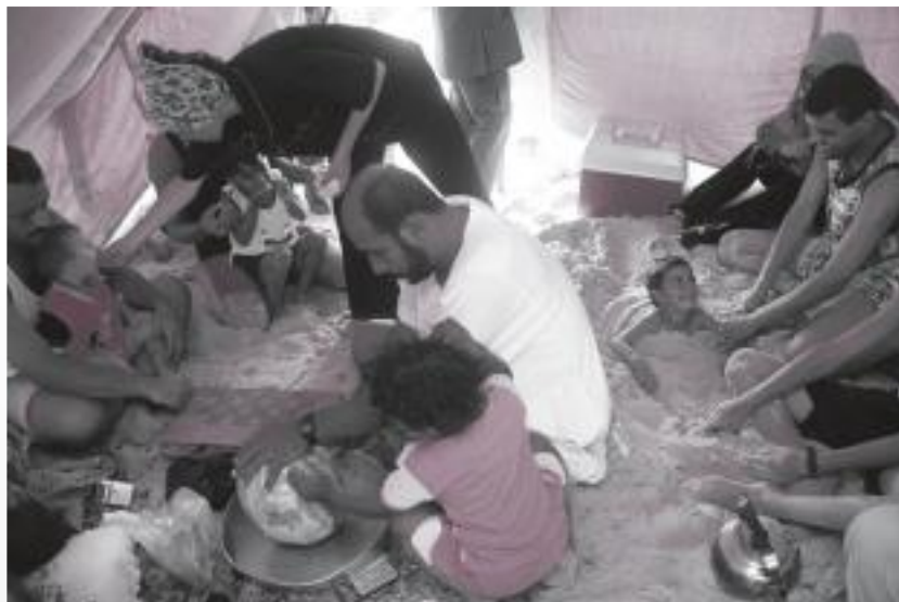
Loma pakolaisteltassa. Gaza elokuva 2003.

Hänen mielestään jo pienetkin teot veisivät tilannetta eteenpäin: palestiinalaisten liikumista pitäisi helpottaa tuntuvasti, maayhteys Gazan ja Länsirannan välillä avata ja siirtokuntien rakentaminen seisauttaa.