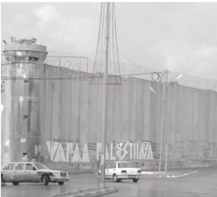
Israelin rakentamaa turva-aitaa Betlehemin kohdalla Länsirannalla.

Israelissa aseistakieltäytyminen on hyvin monimuotoista. Jotkut kieltäytyvät toimimasta miehitysalueella, toiset kieltäytyvät menemästä reservipalvelukseen. Jokainen mies yrittää armeijan käymisen jälkeen määrätä vuosittain kuukaudeksi reservipalvelukseen 43-45 ikävuoteen asti. Myös reservistä kieltäytyminen aiheuttaa vankilareissun. Naisista suurin osa on vapautettu reservipalveluk-