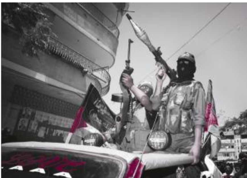
Islamilainen jihad-äärijärjestö juhlii Gazan kaupungissa voittoa Israelista siirtokuntien purkamisen jälkeen. Kuvateksti: Inka Kovanen / Helsingin Sanomat

”Näyttelyssä on kuvia muun muassa Women in Black -järjes-