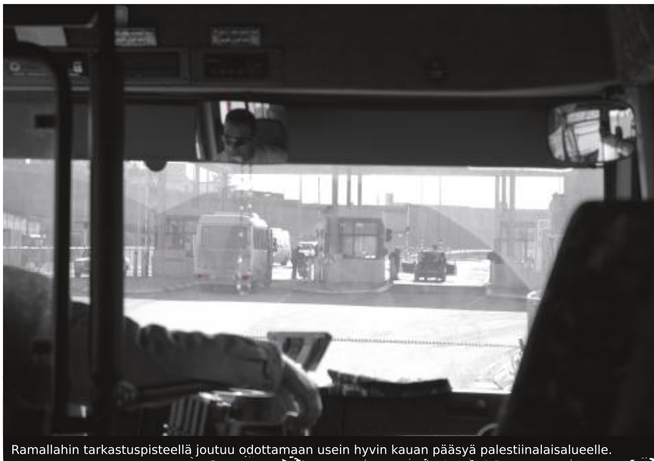
Ramallahin tarkastuspisteellä joutuu odottamaan usein hyvin kauan pääsyä palestiinalaisalueelle.