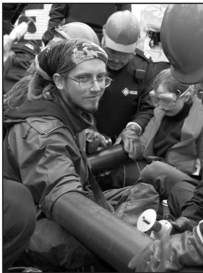
Lukittautuneiden kohdalla puolustusministerion erikoispoliisit joutuivat tulemaan avuksi leikkauslaitteineen.

Lähdimme kävelemään kohti ydinsukellusveneidien laituria. Ohitimme muutamia varastorakennuksia ja helikopterin laskeutumista. Katselimme poliisivenettä ja mietimme olivatko he nähneet meidät ja pitivätkö he meitä