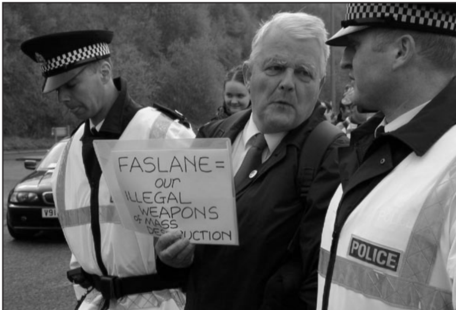
Bruce Kent, ydinaserisuntaliikkeen veteraani edusti mielenosoittajien vanhempaa osanottajakuntaa, mutta monia häntä vanhempiakin jouduttiin pidätettäessä kantamaan poliisiautoon.

Poliisin toiminta oli hillittyä. Alkuun he tyytyivät seuraamaan sivummalta. Jonkin ajan kuluttua alkoi