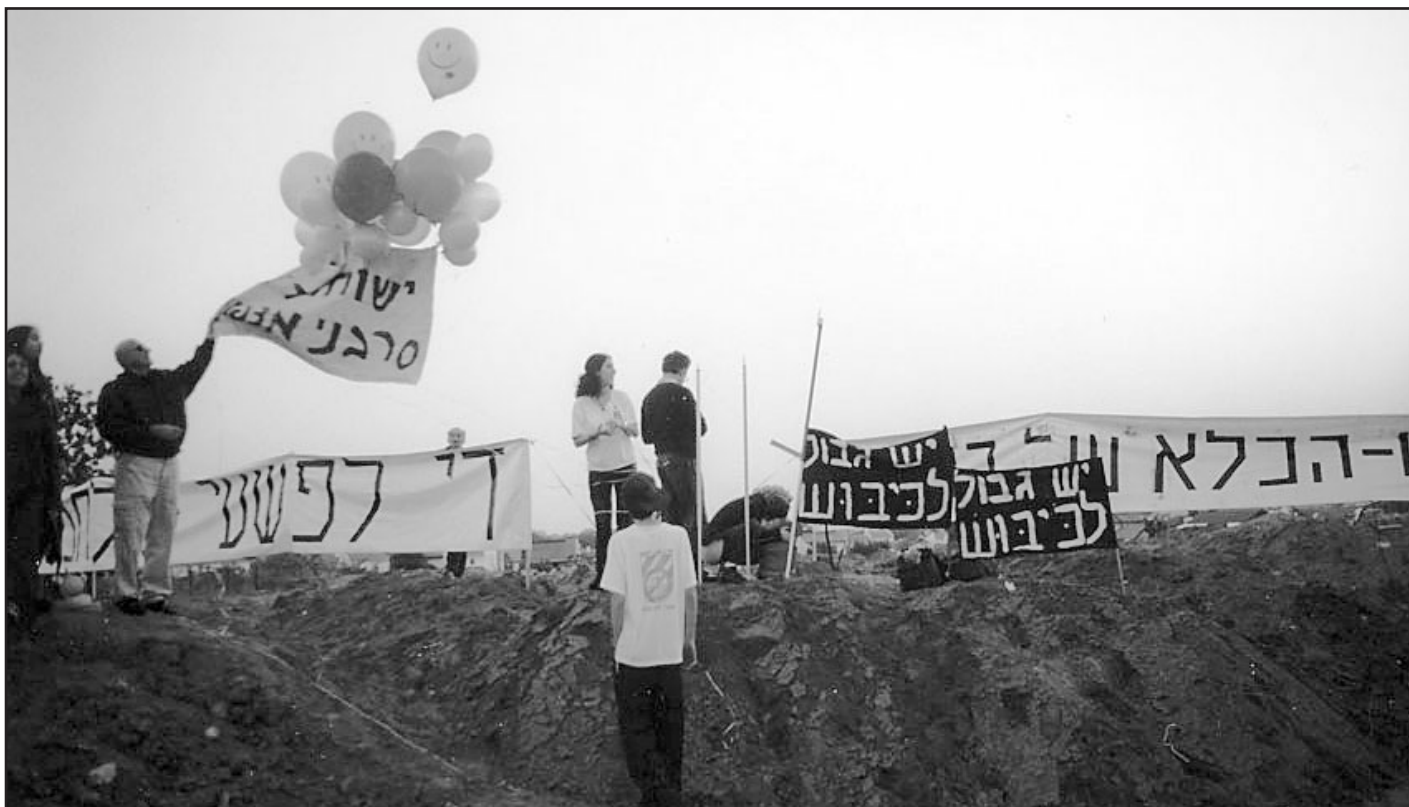
Yesh Gvul 2003