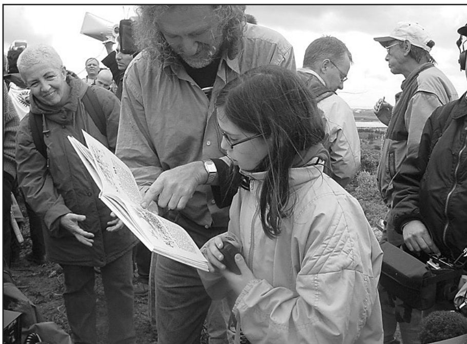
Yesh Gvul 2002

Toinen merkittävä erityisryhmä ovat druusiaseistakieltäytyjät. Kuten yllä mainittiin, druusimiehet, toisin kuin muut Israelin palestiinalaiskansalaiset, kutsutaan armeijaan. Vuodesta 1956 alkaen, jolloin Israelin hallitus päätti kutsua druusimiehet palvelukseen, on ollut olemassa druusiaseistakieltäytyjien liike. Druusikieltäytyjät painottavat tavallisesti sitä, että kieltäytyvät käymästä etnistä sotaa omaa kansaansa vastaan. Heitä pidetään kaltereiden takana tavallisesti huomattavasti pidempään kuin muita aseistakieltäytyjiä.