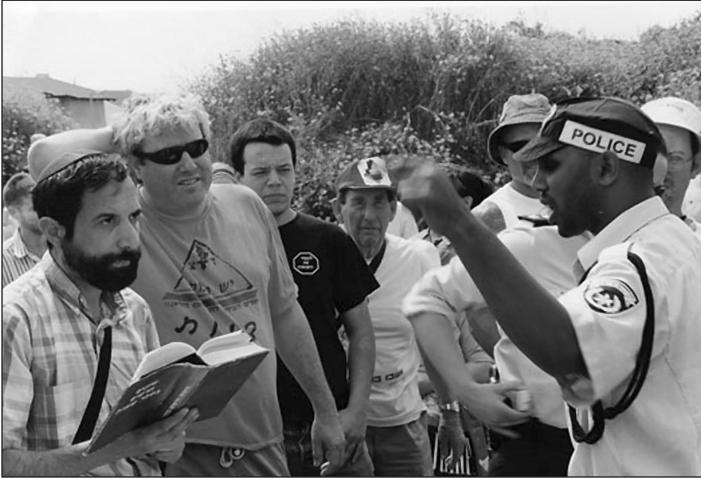
Yesh Gvul 2003