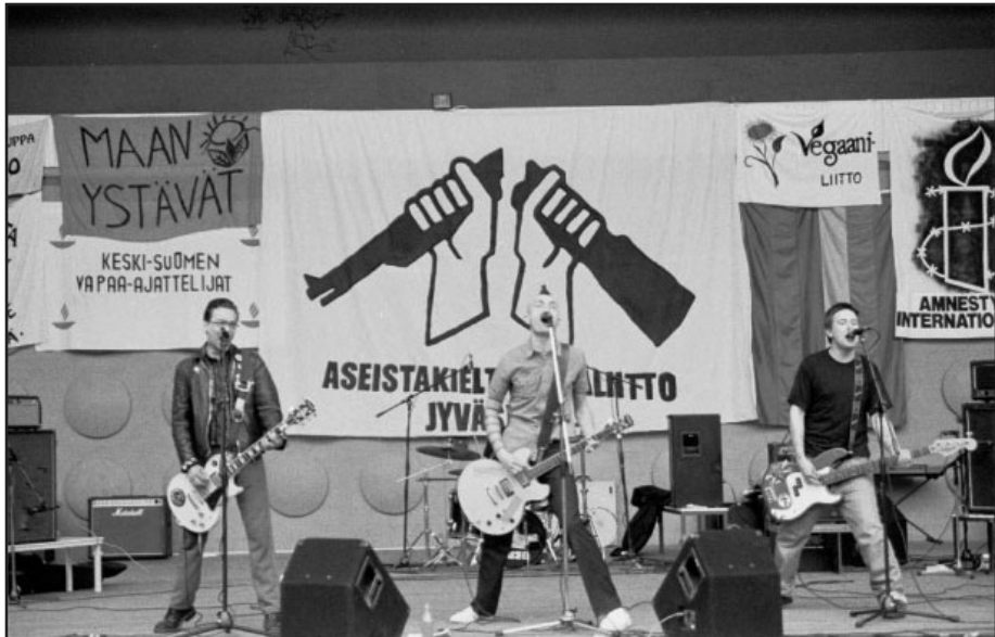
No Shame oli yksi Rauhaa! -konsertin pääesiintyjistä