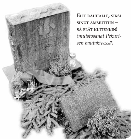
ELIT RAUHALLE, SIKSI SINUT AMMUTTIIN – SÄ ELÄT KUITENKIN! (muistosanat Pekuri- sen hautakivessä)

Helsingin Sadankomitea kerää kansalaisadressia aloitteensa tueksi