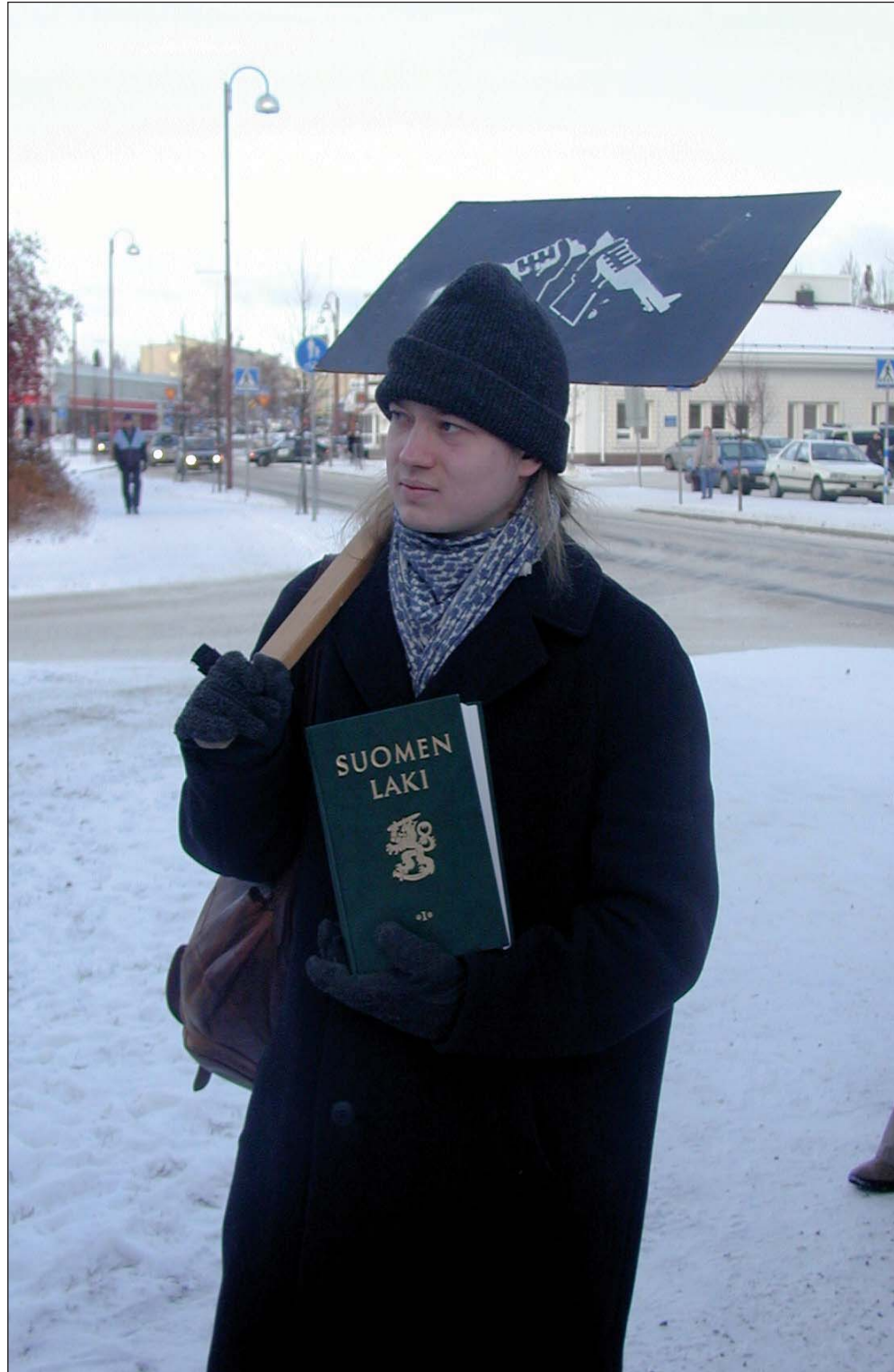
Kuvan henkilö ei liity kirjoitukseen.

Siviilipalvelusjärjestelmässä 80 prosenttia sivarin kuluista jää palvelupaikan hoidettavaksi. Paikan pitäisi tarjota myös asunto ja maksaa päivärahat väliaikaiselle työntekijälleen. Käytännössä näin tapahtuu vain harvoin. Juuri tämä usein kariuttaa palvelupaikan saamisen. Kuitenkin valtio velvoittaa, että pitää suorittaa palvelus, mutta puitteet ovat heikot, jopa surkeat. Palvelupaikkana voi toimia mikä tahansa