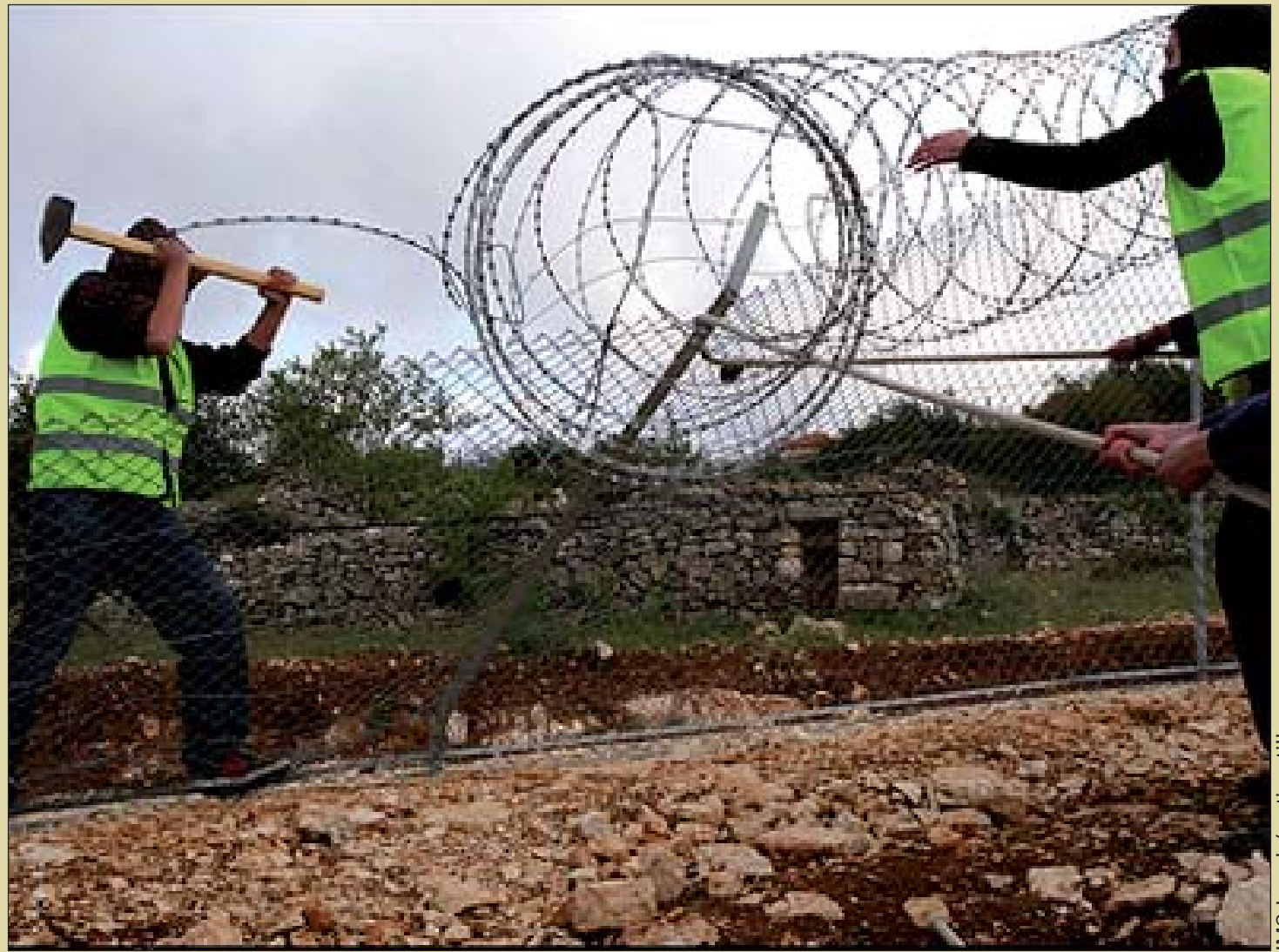
IMC Israel / activistiis.org

S uoraa toimintaa Israelissa palestiinalaiskylän sulkevaa aitoja vastaan Beit Ummarissa, Karmeit Tzurin uudisasutuksen lähellä. 14. huhtikuuta noin 40 aktivistin joukko onnistui purkamaan parin kymmenen metrin pätkän kylää tukahduttavaa aitaa. Israelilaiset uudisasutukset laajentavat omia alueitaan yhä syvemmälle palestiinalaisten kylien maille. Uusin aita Beit Ummarissa