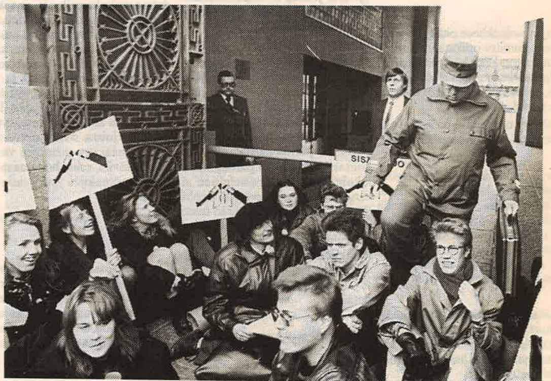
Armeijan uusien esterata. Toiset pomppivat välistä, toiset kierrivät korttelin toiselle puolelle.

Juuri saamiemme tietojen mukaan mielenosoittajat on kutsuttu kuulusteluihin viikolla 45. Pääsemme seuraamaan oikeudenkäyntejä ilmeisesti tulevan talven aikana.