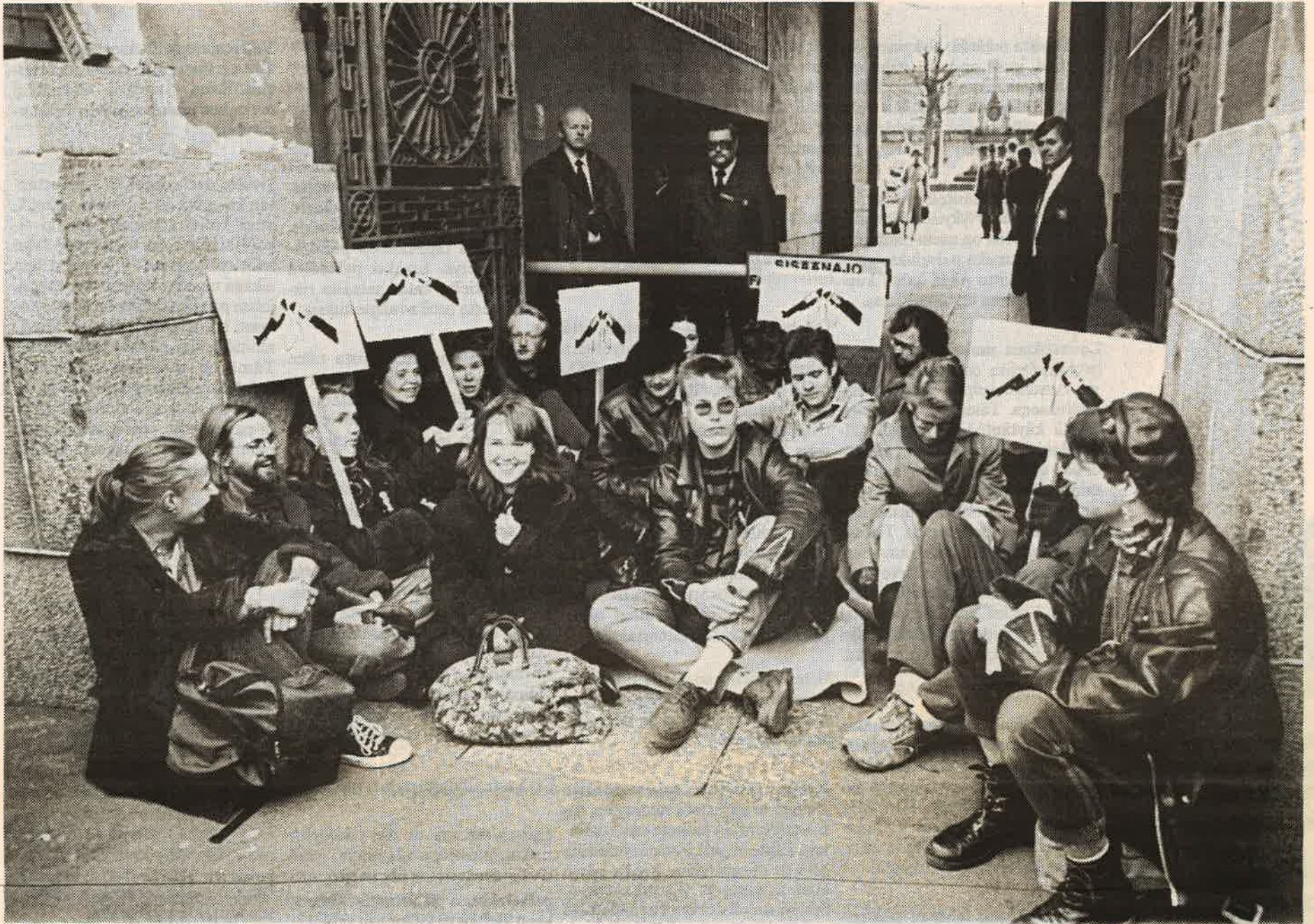
"Harjoitus 90" käynnissä. Osa mielenosoittajista on asettunut istumaan ja vahtimestarit kyrrälevät voimattomina.

YK:n päivänä 24.10. klo 12.00 n. 30 kyltein ja banderollein varustautunutta mielenosoittajaa tukki yhden pääesikunnan sisäänkäynneistä istuutamalla porttikäytävään.