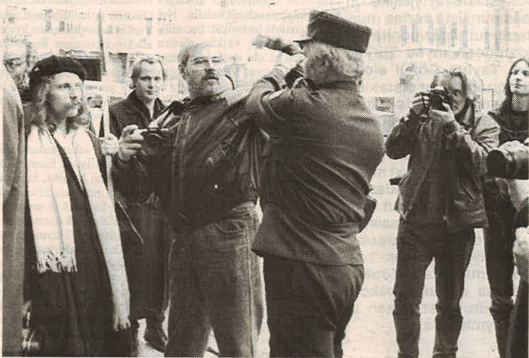
Vanhemman konstaapelin verensuoni nousi ja hän menetti malttinsa. Kuvassa käsirysi lehdistön valokuvaajan kanssa.

Miksi sotaleikkejä aseidenriisuntaviikolla?