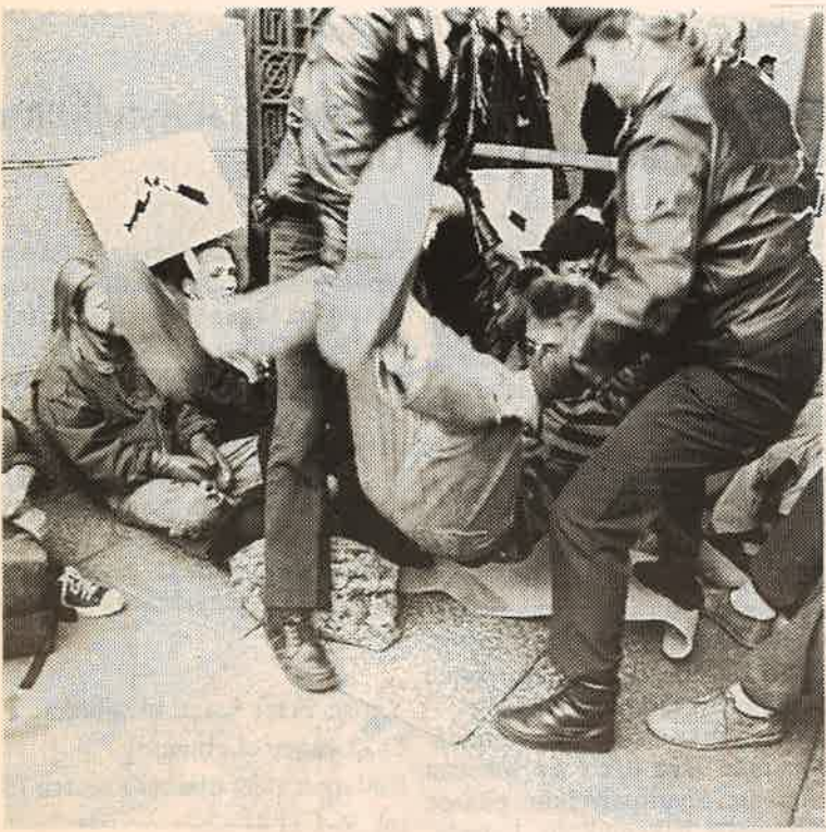
Hii...op! Poliiseille jäi vain kaksi vaihtoehtoa. He valitsivat toisen...