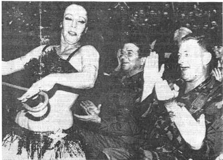
□ Samalla kun Libanonin miehityksen ja palestiinalaisongelman ratkaisuun pyritään eri neuvottelurintamilla, kansainvälisillä rauhanturvaajilla on aikaa heittää vapaalle Beirutissa.

MUUT LEHDET: Tässä urhoolliset rauhanturvaajat vaativassa tehtävässään siellä jossakin.